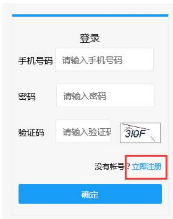
系统登录/注册界面