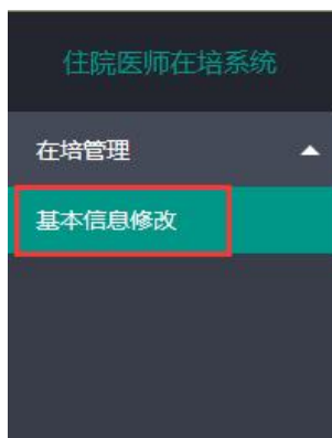
基本信息修改入口